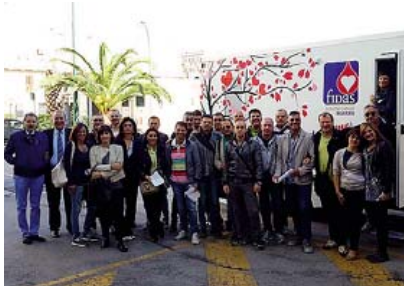
FOTO DI GRUPPO Il questore fra i donatori

La donazione del sangue, che testimonia valori importanti quali la generosità e la solidarietà, viene praticata ormai sistematicamente in Questura con diverse