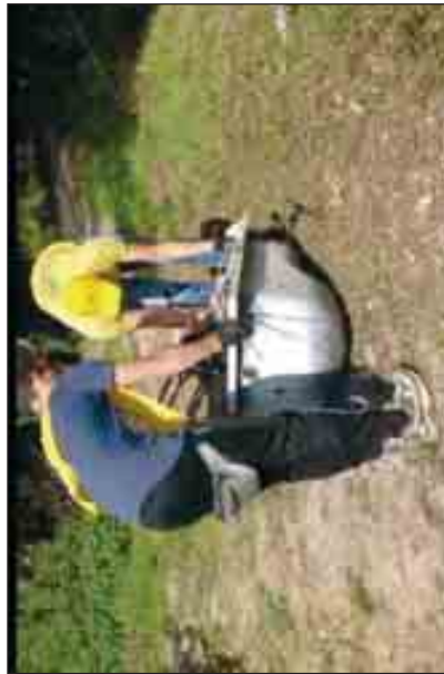
I volontari di Legambiente in azione a Macchia Romana

oggetti. L'iniziativa rientra in un più ampio progetto promosso dall'associazione ambientalista per sensibilizzare cittadini ed amministrazioni sul rispetto della natura. Una vasca da bagno, pneumatici,